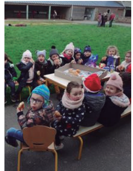
Noël dans les écoles 2021

Ecole primaire catholique proposant la pédagogie Montessori en maternelle et les classes ouvertes en élémentaire.